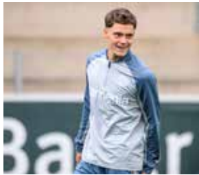
Florian Wirtz Nationalspieler 1. Bundesliga Fritz-Walter- Medaille Gold