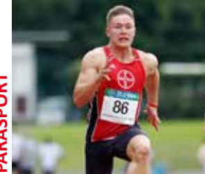
Felix Streng Paralympics-Gold 2020 (100m)