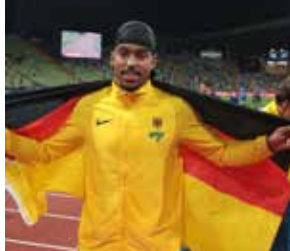
Bo Kanda Lita Baehre Mehrfacher Deutscher Meister EM-Silber 2022