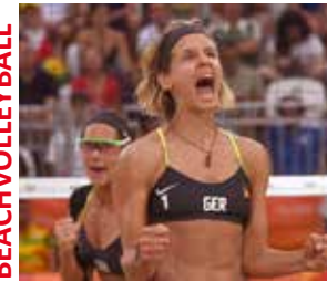
Laura Ludwig Olympiasiegerin 2016 (Beach)