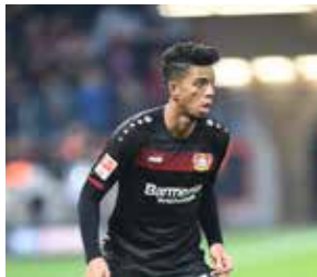
Benjamin Henrichs Nationalspieler 1. Bundesliga