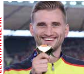
Mateusz Przybylko EM-Gold 2018 Hallen-WM-Bronze 2018