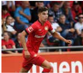
Kai Havertz Nationalspieler 1. Bundesliga CL-Sieger 2021