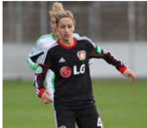
Kathrin Hendrich Olympiasiegerin 2016 CL-Siegerin 2015