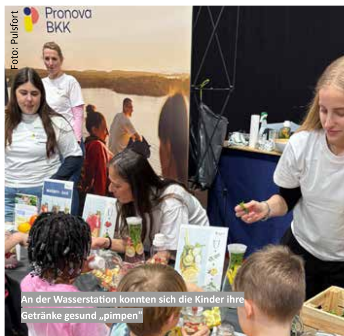
An der Wasserstation konnten sich die Kinder ihre Getränke gesund „pimpen“