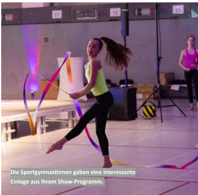
Die Sportgymnastinnen gaben eine interessante Einlage aus ihrem Show-Programm.

Die Auszeichnung „Eliteschülerin des Jahres“ wird unterstützt vom Sparkassen- und Giroverband und soll Talente sichtbar machen, die Leistungssport und schulische Bildung erfolgreich miteinander verbinden. (UP)