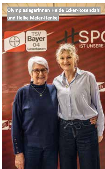
Olympiasiegerinnen Heide Ecker-Rosendahl und Heike Meier-Henkel