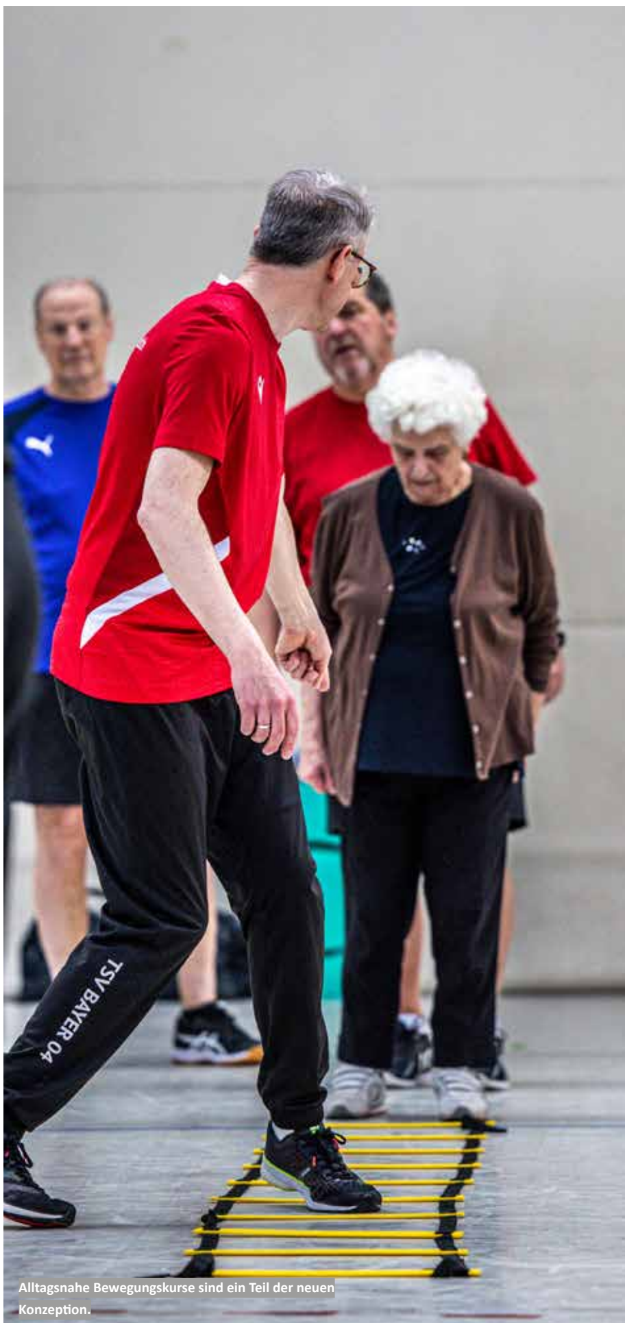
Alltagsnahe Bewegungskurse sind ein Teil der neuen Konzeption.