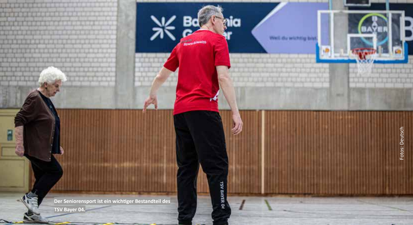
Der Seniorensport ist ein wichtiger Bestandteil des TSV Bayer 04.