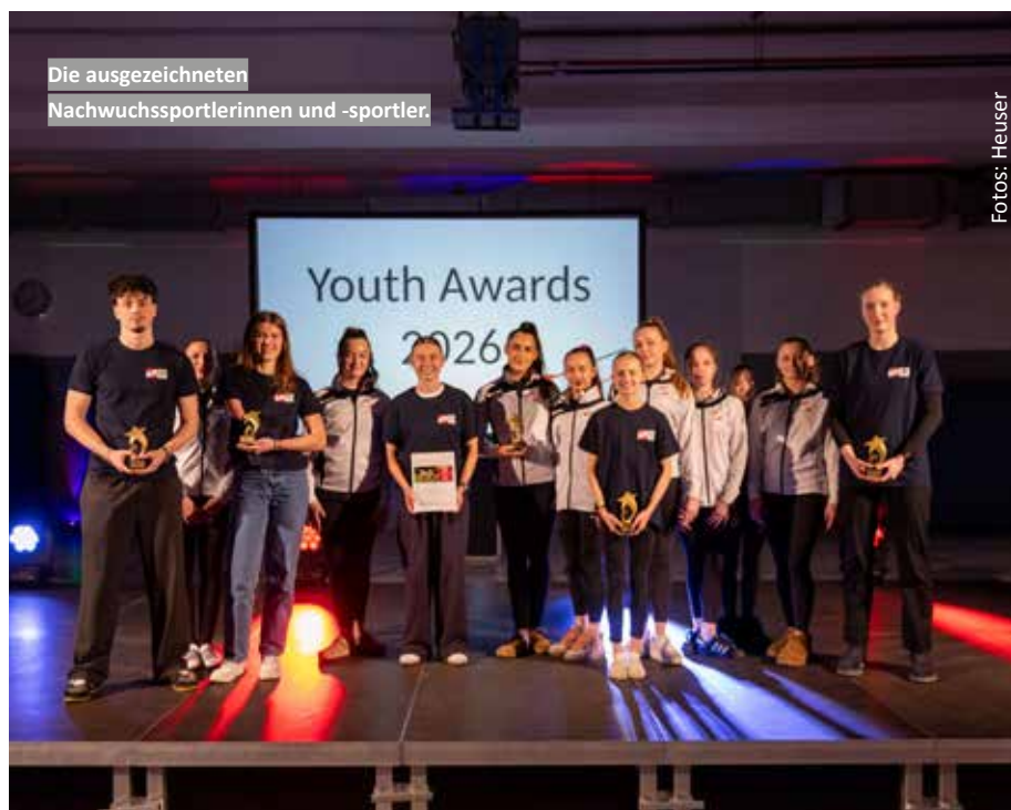
Die ausgezeichneten Nachwuchssportlerinnen und -sportler.

„Was hier in Leverkusen passiert, ist eine großartige Grundlage für die Zukunft“, resümierte Sport-Ikone Heide Ecker-Rosendahl.