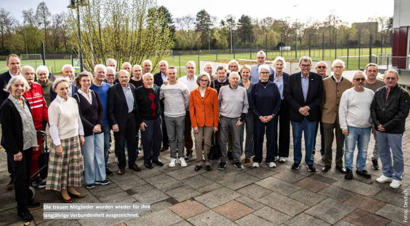
Die treuen Mitglieder wurden wieder für ihre langjährige Verbundenheit ausgezeichnet.