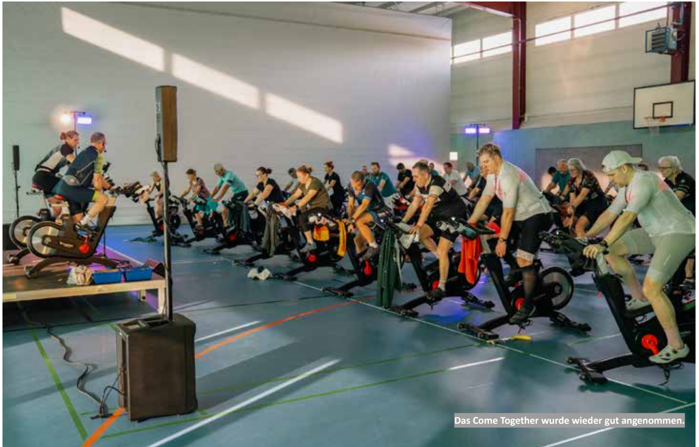
Das Come Together wurde wieder gut angenommen.

Zum Jahresbeginn hieß es beim TSV Bayer 04 Leverkusen: Come Together- GO4MOVE mit Bring your Friend Special. Die Mitmach-Aktion GO4MOVE lockte über 300 Teilnehmer*innen auf die Kurt-Rieß-Anlage und machte das Fitness&Health Angebot für zahlreiche neue Gesichter erlebbar.