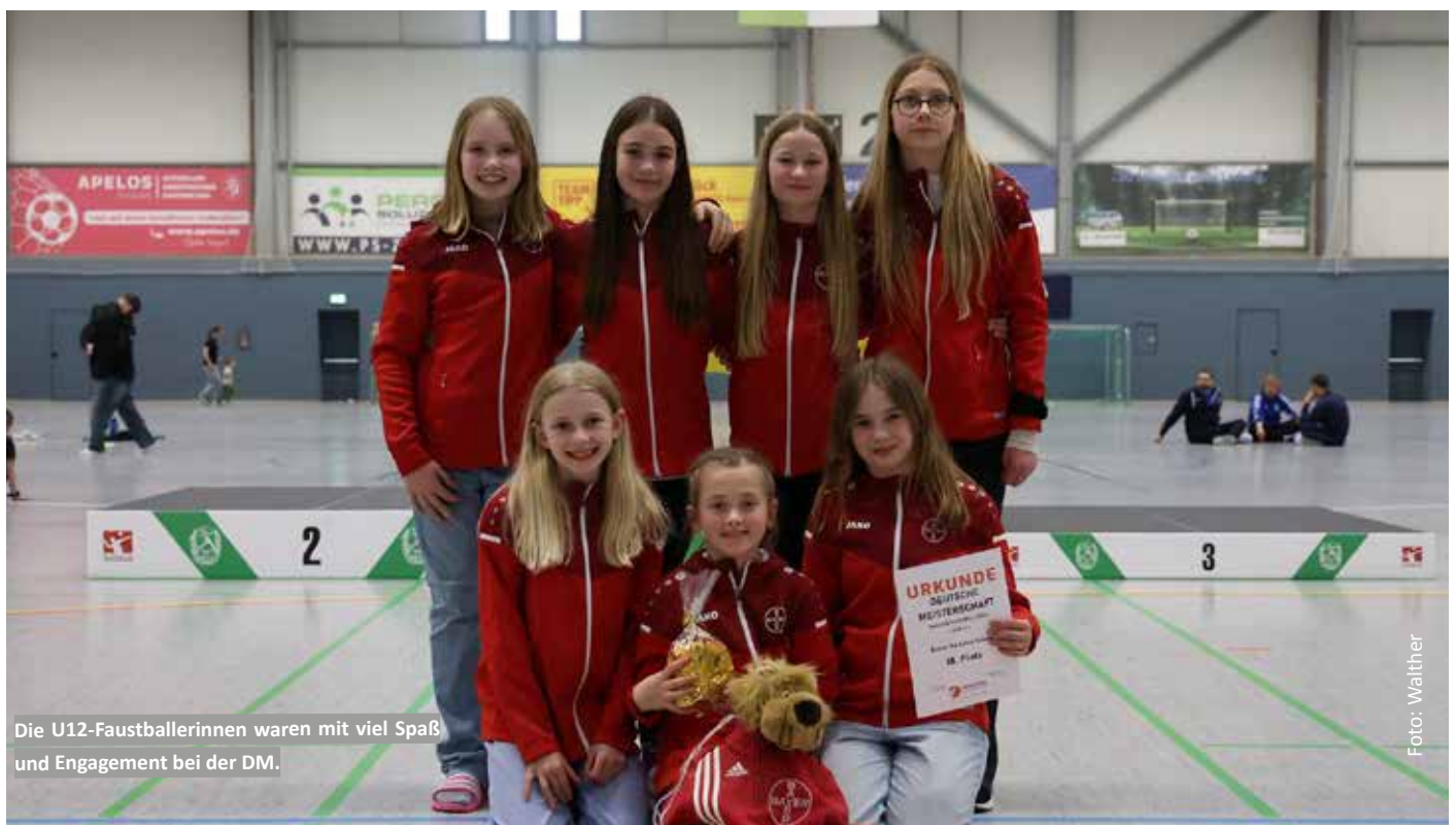
Die U12-Faustballerinnen waren mit viel Spaß und Engagement bei der DM.