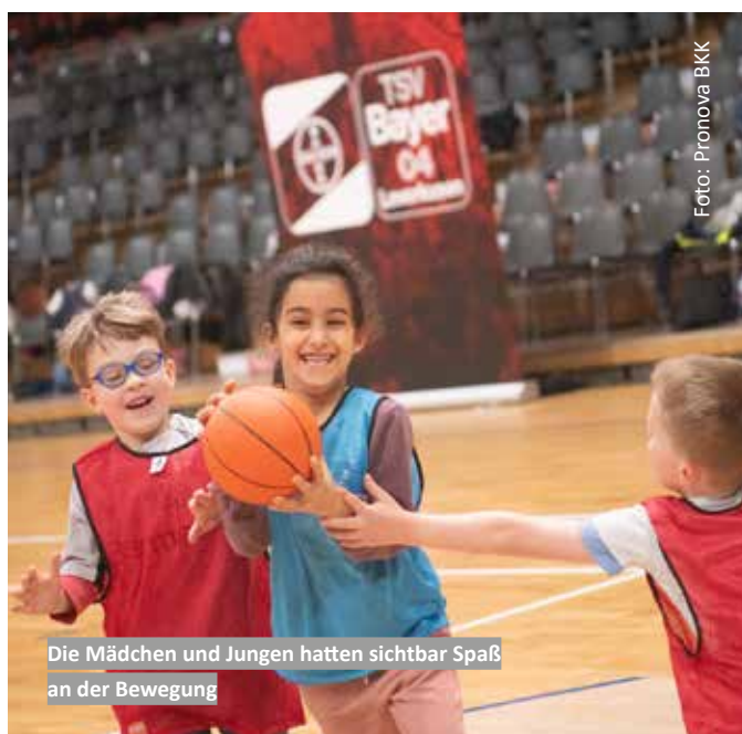
Die Mädchen und Jungen hatten sichtbar Spaß an der Bewegung