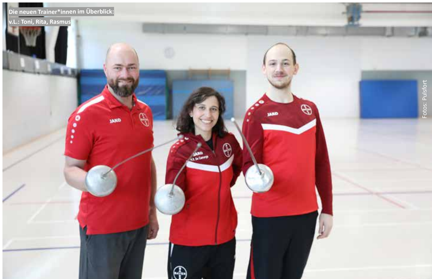
Die neuen Trainer*innen im Überblick: