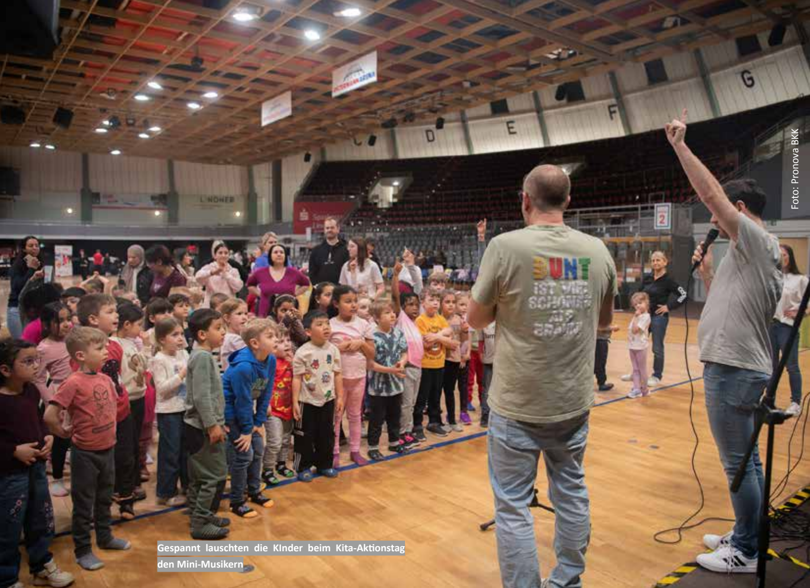
Gespannt lauschten die Kinder beim Kita-Aktionstag den Mini-Musikern