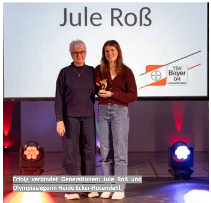
Erfolg verbindet Generationen: Jule Roß und Olympiasiegerin Heide Ecker-Rosendahl.